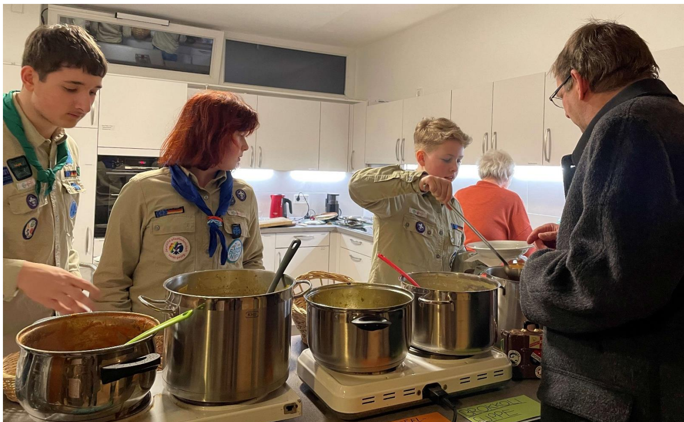
Pfadfinder helfen beim Patronatsfest – Herzlichen Dank!