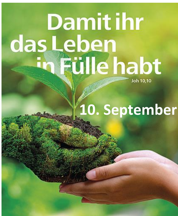
Plakat der diesjährigen Aktion

Die Idee für einen Schöpfungstag stammt aus einer gemeinsamen Initiative der orthodoxen Kirche mit Papst Franziskus. Der 1. September ist der Beginn des orthodoxen Kirchenjahres und der 4. Oktober der katholische Gedenktag des Heiligen Franz von Assisi. Es entstand der Wunsch, dass innerhalb dieses Zeitraumes überall in der Welt gemeinsam für die Bewahrung der Schöpfung gebetet werden solle. Beim zweiten Ökumenischen Kirchentag in München 2010 wurde die Initiative aufgegriffen und ein „Tag der Schöpfung“ von der Arbeitsgemeinschaft Christlicher Kirchen in Deutschland (ACK) deutschlandweit ausgerufen. Seit dem feiert die ACK jährlich im September einen ökumenischen Tag der Schöpfung. Im Mittelpunkt stehen das Lob des Schöpfers, die eigene Umkehr angesichts der Zerstörung der Schöpfung und konkrete Schritte zu ihrem Schutz.