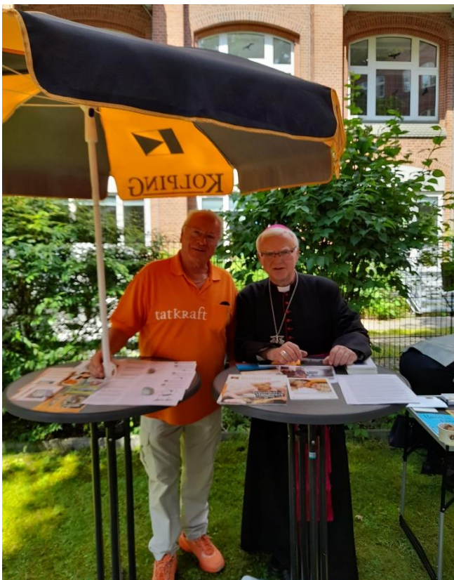
Bischofs-Besuch am Kolpingstand