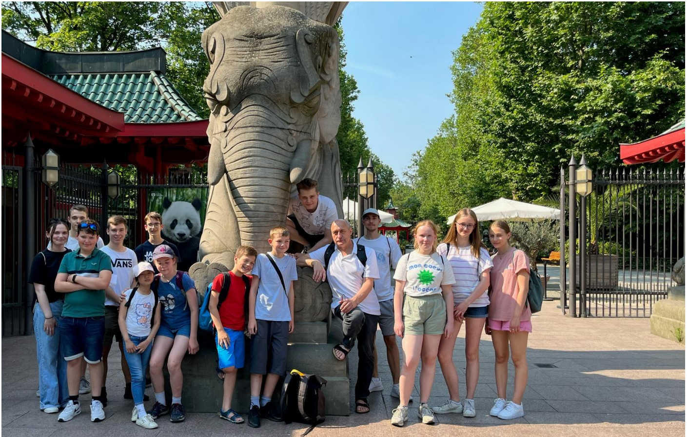
Dankeschön der Pfarrei an die Minigruppen - Ausflug zum Aquarium am 9. Juli

23. September (Samstag) – gemeinsame Teilnahme und Anreise