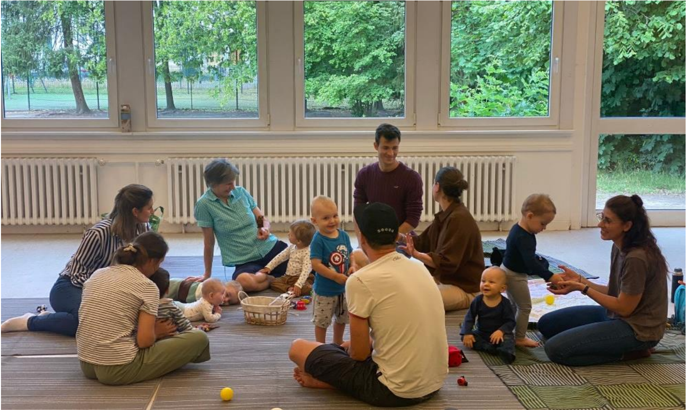
Eine der Eltern-Kind-Gruppen St. Alfons