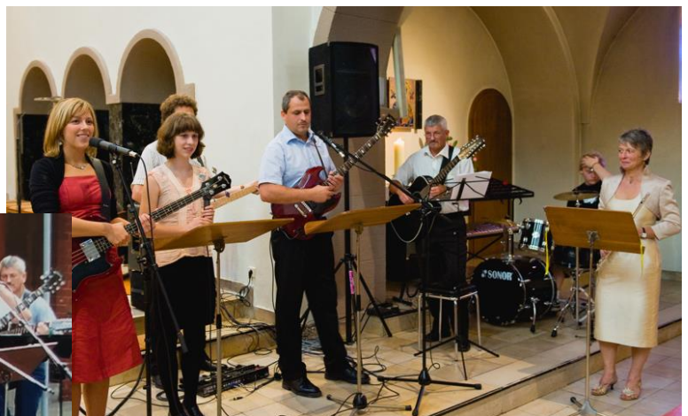
St. Alfons 2008