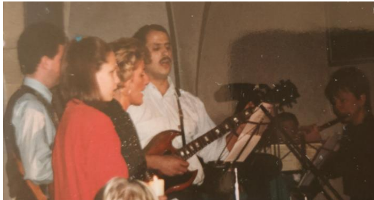
St. Alfons 1993

Im Frühjahr 1993 fassten fünf Eltern aus der Pfarrei St. Alfons den Entschluss, sich bei der musikalischen Gestaltung von Sonntagsgottesdiensten für Familien einzubringen. Nach erfolgreichen Abstimmungen mit dem Pfarrer und dem damaligen hauptamtlichen Organisten, Herrn Ohnewald, hatten wir dann unseren ersten „Auftritt“ am 16. Mai 1993 in der Kirche St. Alfons. Fortan gestalteten wir dort musikalisch einen