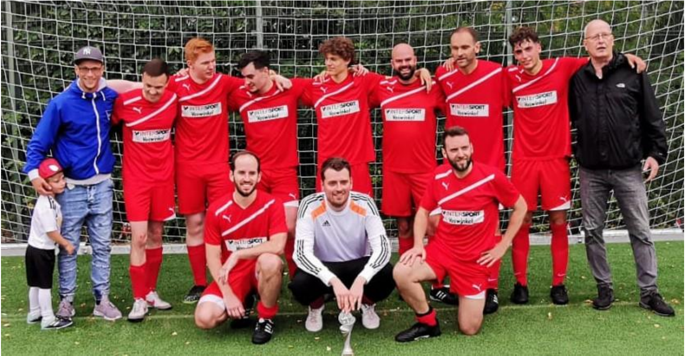
Mannschaft St. Alfons wurde „BDKJ-Stadtliga-Pokalsieger 2022“

Seit über 42 Jahren gibt es die BDKJ-Stadtliga. Hier spielen Freizeitfußballer oder Freizeitmannschaften Berliner katholischer Pfarreien jährlich den BDKJ-Stadtliga-Meister, -Pokalsieger und -Hallenmeister aus. Gespielt wird freitags ab 18.30 Uhr auf dem Kunstrasenplatz der Carl-Schuhmann-Sportanlage (Osdorfer Straße 52, in 12207 Berlin-Lichterfelde). Die Fußballmannschaft von St. Alfons ist als Gründungsmitglied ununterbrochen dabei und wurde im vergangenen Jahr Meister und Pokalsieger (siehe Fotos). Es sind vor allem fußballbegeisterte Freizeitsportler im Alter von 16 bis 40 Jahren (und älter), die hier ihre fußballerischen Kräfte messen. In jeder Mannschaft dürfen maximal 3 Spieler auf dem Spielfeld stehen, die aktiv in einem Fußballverein spielen. Gespielt wird auf Kleinfeld (eine Hälfte vom Großfeld) mit sechs Feldspielern und einem Torwart. Es darf beliebig gewechselt werden. Für die kommende Spielzeit ab September 2023 suche ich interessierte Mannschaften, die am Spielbetrieb teilnehmen wollen. Erforderlich für die Teilnahme sind grundsätzlich 20 Spieler pro Mannschaft, was die Erfahrungen der vergangenen Jahre gezeigt haben. Pro Saison sind von jedem Team 150 – 200 € für Versicherung, geprüfte Schiedsrichter und Pokale zu entrichten. Unsere Pfarrei St. Maria – Berliner Süden kommt gern für diesen Betrag auf.