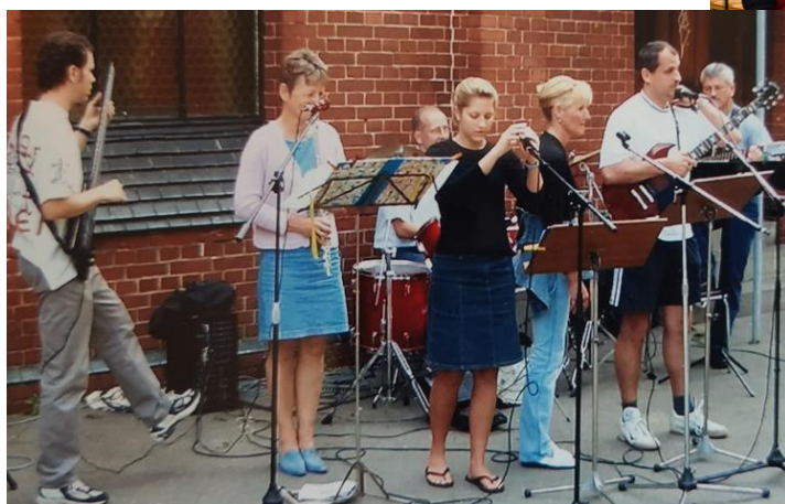
Vom Guten Hirten 2004