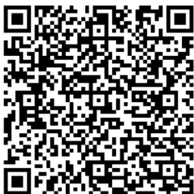
QR-Code zum Formular